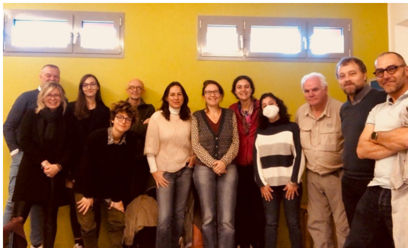
L'équipe ATRE au lancement du projet à Bologne en Italie les 14 et 15 mars 2022